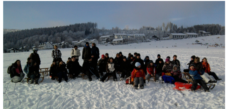
Ausflug des Jugendchores und des Kinderchores II am 05.01.2010 nach Willingen zum Rodeln.